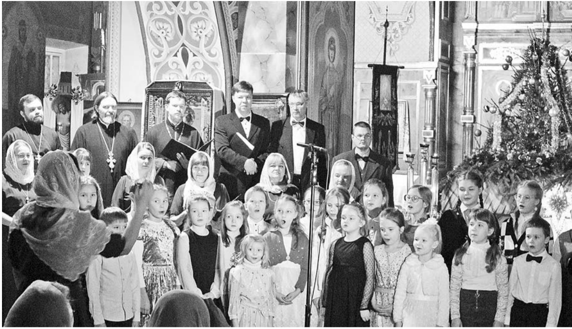
В смешанном хоре Успенского собора – 22 человека. В следующем году коллектив отметит своё 30-летие. На снимке – хор и воспитанники ДШИ.